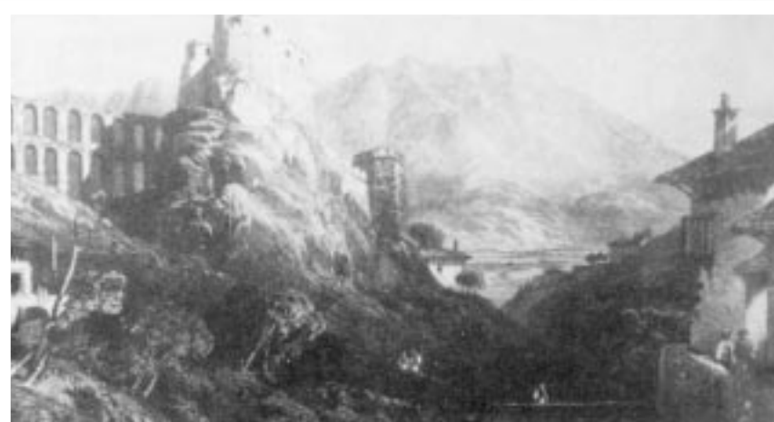
Αργυρόκαστρο (Γκραβούρα του περασμένου αιώνα)

Αριθμ. Λογ/ομού: 56.000.393787.601.01.23 Eurobank και 31284414 Εμπορική Τράπεζα «Ο ΔΗΜΟΦΩΝ» ανταλλάσσεται με όλα τα έντυπα πολιτιστικού περιεχομένου